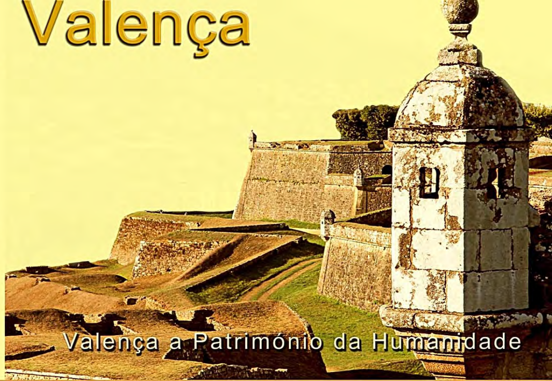
Valença a Património da Humanidade

Valença is different. A border city, with History and own stories. The Fortress, a monument of global value, with substantial dimensions and an impeccable state of conservation, traditional trading and thousands of visitors that you can find here, provide an unique experience, blending monuments, commerce, gastronomy and multiculturalism. Come visit Valença and let yourself be overwhelmed by the flavor, history and culture of the Fortress.