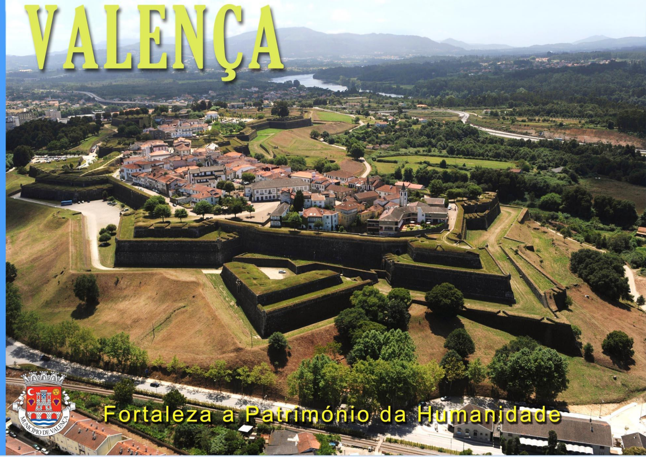
Fortaleza a Património da Humanidade